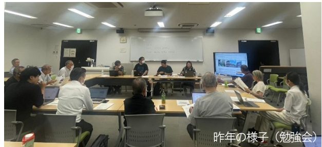
昨年の様子(勉強会)