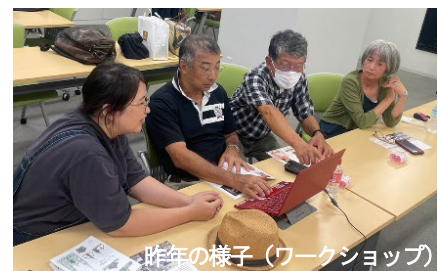
昨年の様子(ワークショップ)