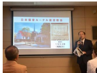
日本福音ルーテル復活教会の紹介

総会後には登録文化財紹介の時間を設け、3つの登録文化財(日本福音ルーテル復活教会、三井家住宅、豊橋市上水道施設)について、それぞれの所有者・管理者の方からご紹介いただきました。