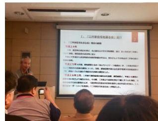
三井家住宅の紹介