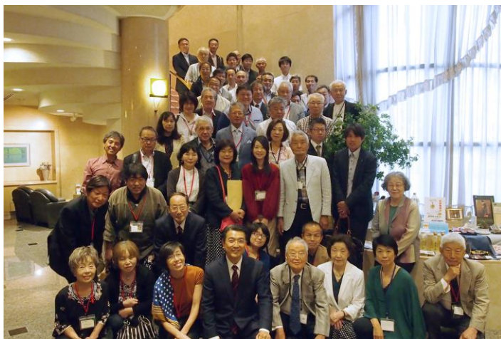
古川美術館にて記念撮影

開催にあたり、古川美術館の皆様にご協力いただき、総会開催前には展示作品を解説いただきました。