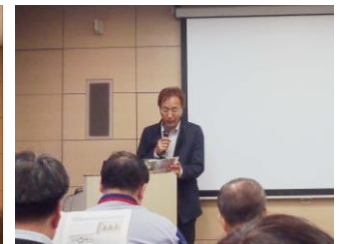
豊橋市上水道施設の紹介