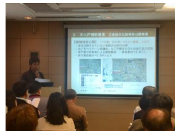
平成30年度事業報告