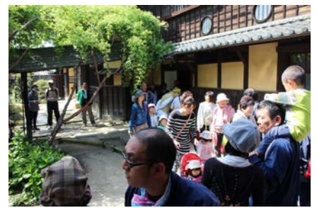
▲萬三の白モッコウバラ祭り

また、大学の研究グループにより、小栗家保有の古文書の調査研究活動も積極的に実施されており、地域の歴史や文化に関連する情報発信にも力を入れています。