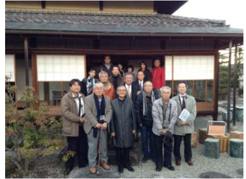
▲五箇荘 塚本家にて

訪問先は何れも保存の志を持った方々が大変な苦勞をして建物の保存活用に努めてみえます。しかし旧日夏村に孤立して建つ日夏里館と近江商人の町並みが残る旧八幡郵便局及び重伝建地区の塚本邸とは訪れる客数に大きな隔りがあります。建物は人と同じく観られてこそ一層魅力を増すのではないのでしょうか。未登録文化財の登録を促し、ネットワークを構成して大勢に観て触れて貰う事が肝要だと感じました。