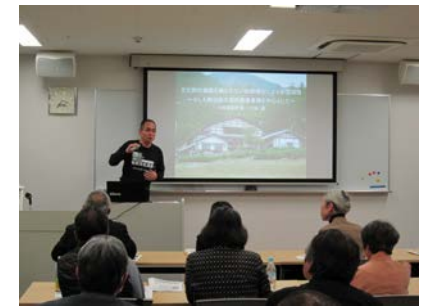
▲川端氏の講演風景