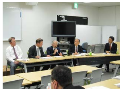
▲愛知登文会も加わった座談会の様子