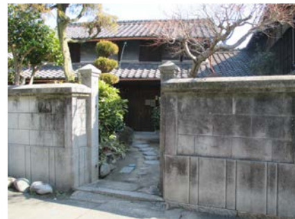
▲旧知多貯蓄銀行岡田支店跡

郵便局の修理では、地元の方にご協力いただいているので、恩返しに古民家を買いました。築100年にはなると思われれます。何に使うかまだ計画はありませんが、登録文化財になれば登録はしていきたいと思います。