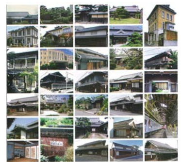
国登録有形文化財建造物マップ 和歌山県