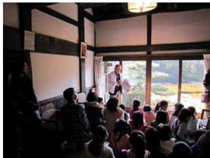
▲柴田氏による庭園の解説風景