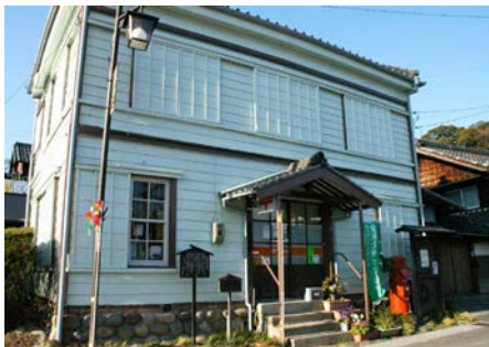
▲知多岡田簡易郵便局

平成25年には、国の登録有形文化財として、知多市で初めての登録となりました。今も現役で営業を続けていますが、木造造りの局舎では、日本で最古クラスだろうと言われています。