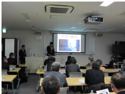
▲大木氏による半田市の観光の取組みのお話