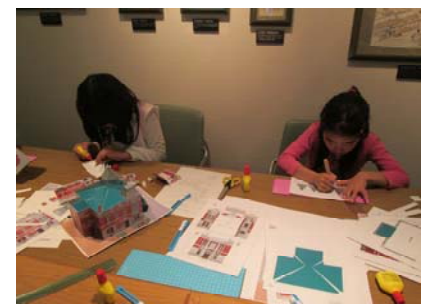
みんな集中して制作