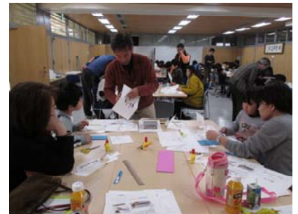
▲墨会館での折り紙建築制作風景