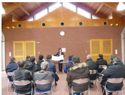
前半の座学の様子