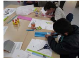
カッターと定規を上手に使って紙を切ることも達