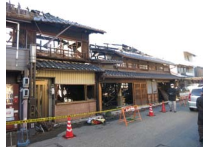
▲犬山市本町通りの火災現場

早くから住民組織が出来上がっている高山の重要伝統的建造物群保存地区では隣組組織がしっかりしていて、日頃から訓練が行われている。