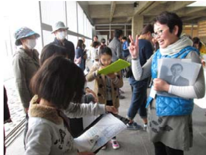
ガイドさんと一緒に建物の謎解きに挑戦