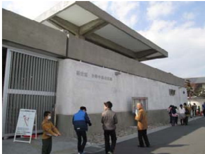
墨会館の外周を回って建物の形を勉強