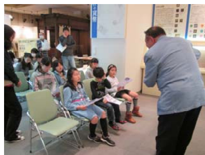
解説を聞く子ども達