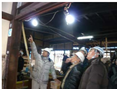
林氏より解説いただきながら工事現場を見学