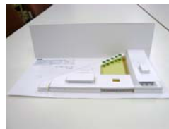
▲墨会館の折り紙建築

そして、こども達の掌に建物を載せることには価値があると思います。だって何時の時代も子供たちの掌の中には夢や希望がいっぱい詰まっていますから。