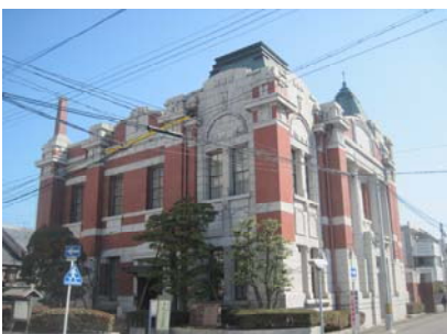
岡崎信用金庫資料館の外観