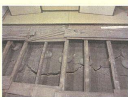
今も保存されている濃尾地震の地割れ

玄関をくぐり、長い路地を渡ると見えてくるのが母屋です。母屋は茅葺きで、「四つ建」という建築様式です。四つ建とも呼ばれ、外壁から半間(約0.9メートル)、もしくは一間(約1.8メートル)入った位置に主柱を立て、他の主柱と梁材でつなぐ形式です。内部は台所や座敷、納戸など四室からなっていて、「建築方や間取りなどは、尾張地方の農家の典型的なスタイルで成り