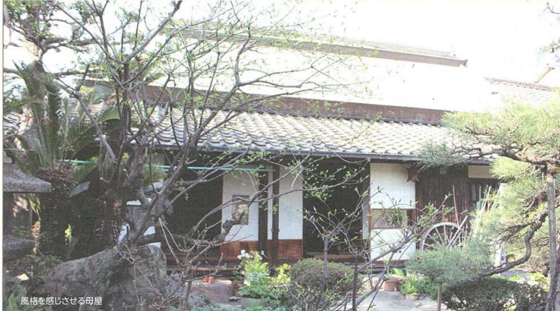
風格を感じさせる母屋