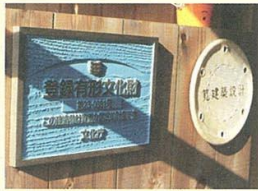
国の登録有形文化財のプレート

広告掲載・編集・取材についてのお問い合わせは 中日ホームニュース編集部 〒451-0042 名古屋市中区西区那古野1丁目20-9 TEL / 052-726-5728 Fax / 052-308-3710 メールアドレス / homenews@f-creative.co.jp