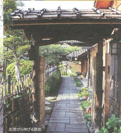
玄関から伸びる路地